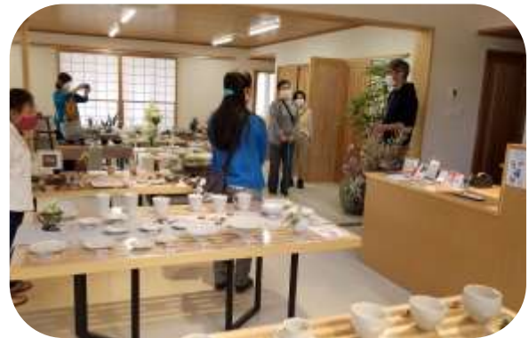
ギャラリーにて大堀相馬焼の歴史など説明を受けている様子。