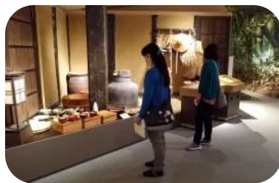
昔のお膳料理なども展示