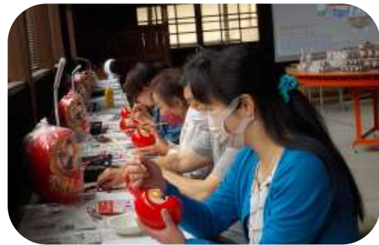
絵付け体験中。筆を使って描くのは難しい。