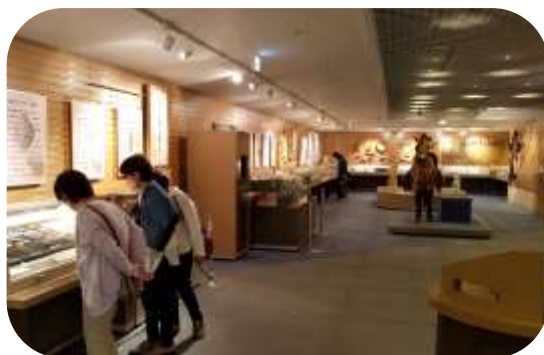
県内で出土した土器など多数展示