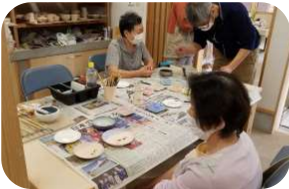
今回は絵付け体験。色や絵柄を悩みながら世界に一つだけの作品を思考中。