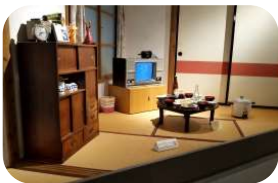
懐かしい昭和レトロな様子