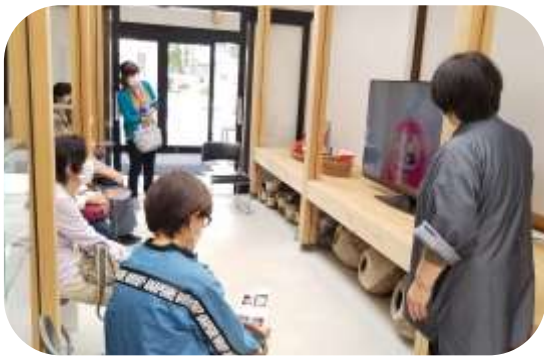
白河だるま紹介映像を見ながら学んでいる様子。