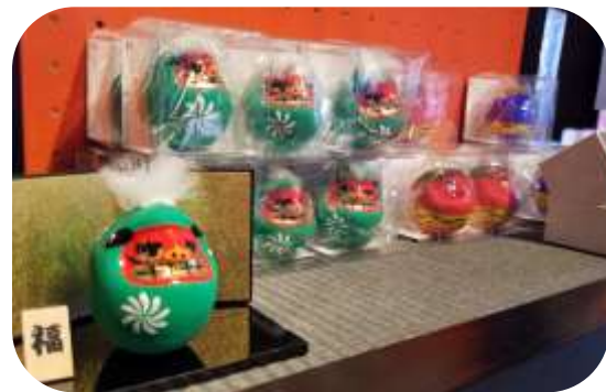
キャラクター・干支や祝い用など、だるまも多様化