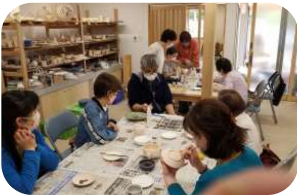
教わったとおりには描けず、講師より丁寧にゆっくりと解説を受けている様子。