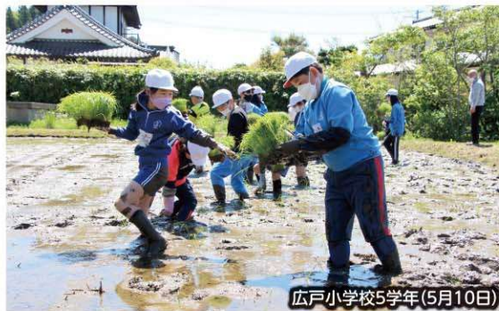
広戸小学校5学年(5月10日)