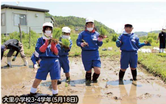
大里小学校3・4学年(5月18日)