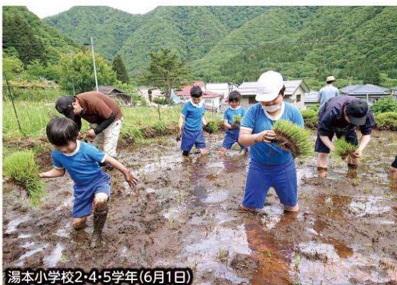
湯本小学校2・4・5学年(6月1日)