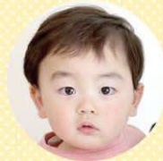
そえ た 添田 ちほる 千晴くん