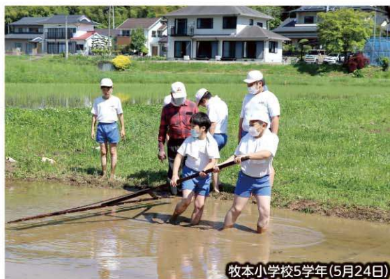
牧本小学校5学年(5月24日)