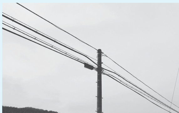
村で整備した光ファイバ

村が整備した光ファイバケーブル等の関連設備の耐用年数である10年が経過し、今後、設備の維持管理や更新に多額の費用が生じる事が見込まれています。これまで村から設備を借受けして、サービスを提供してきた通信事業者に対して無償譲渡することで、将来にわたる安定した通信環境の提供と、村が負担してきた設備の維持管理費用の削減を図るためです。