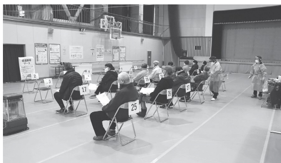
新型コロナウイルスワクチン3回目接種の様子

小中学校の統合について、現在どこまで進行しているか。村民の皆様にはわかりやすく具体的に、これまでの統合にかかる対応の経過を伺いたい。