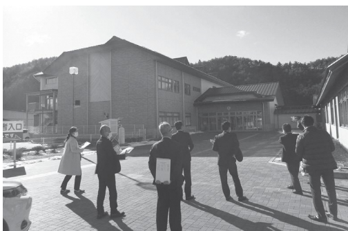
先進地視察の様子

これまでに、天栄村立小中学校のあり方検討委員会や、天栄村立小中学校統合委員会から、答申や意見を提出していただいております。さらに、昨年度と今年度には、先進地の視察を行って参りました。現在は、これらの情報を基に、校舎等の適正規模や必要となる敷地面積などについて精査し、基本設計の策定に向けた準備を進めているところであります。