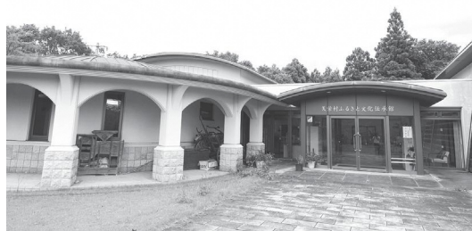
過疎債を利用し建てられた天栄村ふるさと文化伝承館

優遇措置を活用するためには、地域の課題や持続的発展の方針を明記した「過疎地域持続的発展市町村計画」を策定する必要がありますので、村総合計画など