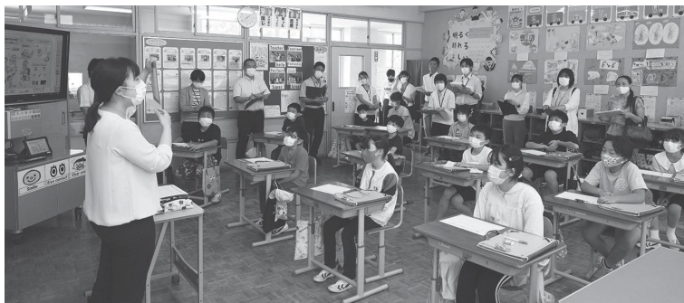
授業を受ける児童たち（牧本小学校）

2点目の予算の見込みにつきましても、現在、先進地視察の情報等を基に、校舎等の適正規模や必要とな