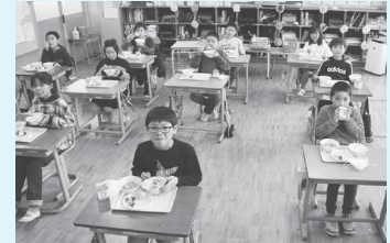
新年度より学校給食でSDGsを意識した給食を提供