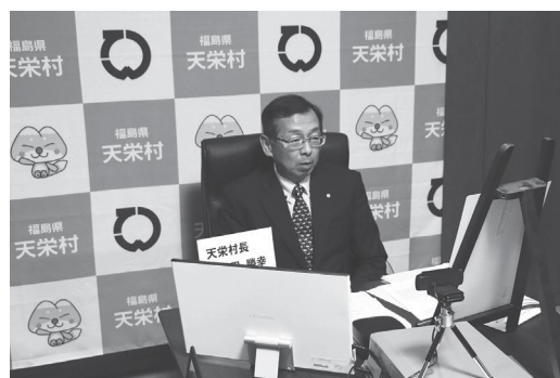
令和3年度「地下水サミット」の様子(オンライン開催)

地下水連絡協議会地下水サミットは、安全・安心で美味しい豊富な天然の地下水を守るため、国等と連携し地下水保全に取り組む目的で、年1回11月10日、「いい井戸の日」に加盟市町村の輪番制で行っています。加盟市町村は、現在9町村です。サミットの内容は、連絡協議会の総会や地下水資源の基調講演等を予定しています。