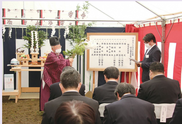
出席者全員で工事の安全を祈りました

工期は、令和5年3月までとなります。また、新年度には新たな道の駅施設の建設も着工する予定です。