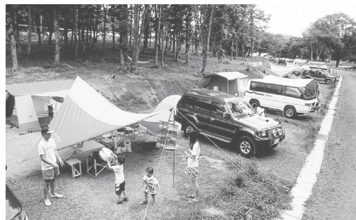
羽鳥湖畔オートキャンプ場