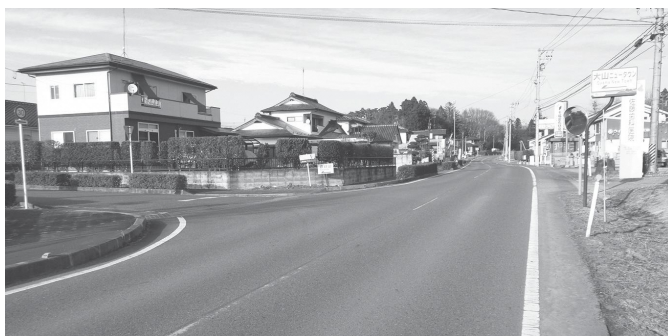
横断歩道が望まれている県道

2点目の、大山団地から天栄クリニック等へ渡る横断歩道の設置につきましては、今回、初めてお聞きする内容ですので、まずは、須賀川警察署へ相談したいと考えております。