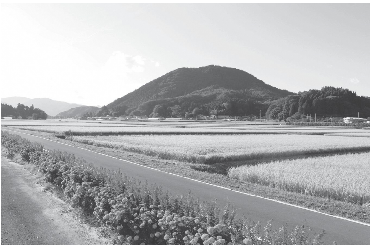
村の基幹産業である農業

どで、主食用米の需要減少が続く中、米価について上昇を見込むことは難しい状況であると認識しています。村としても、令和4年産米についても飼料用米を中心とした非主食米への転換を推進するとともに、農業収入保険やナラシ対策への加入を促進していく考えです。