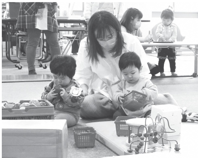
親子で遊んでいる様子（びびびよくらぶ）

かと考えました。近隣町村でも同じような対応をしており、総合的に判断させていただきます。 2 点目につきましては、議案の説明が不十分であり、趣旨をうまくお伝え出来ず申し訳ありませんでした。今後は、このようなことのないよう丁寧な説明に努めてまいります。