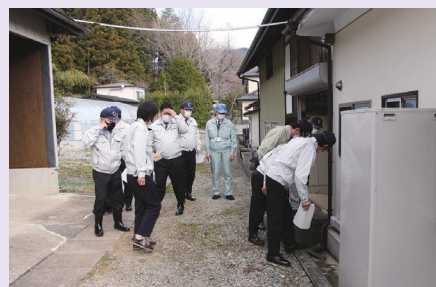
女神地区の被災状況を調査

このような状況を受け、村議会でも早急な復旧が行われるよう、関係機関に働きかけを行ってまいります。