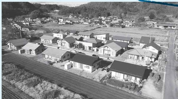
定住促進村営住宅

近年の少子化により多子世帯が減少していることから、「12歳以下の子ども2人以上有する世帯」が少なくなり、現在の入居条件に合致しないことがあるため現状に即した要件へ緩和するもので、「2人以上」という条件を削り、12歳以下の子ども1人でも定住促進村営住宅への入居が可能となりました。