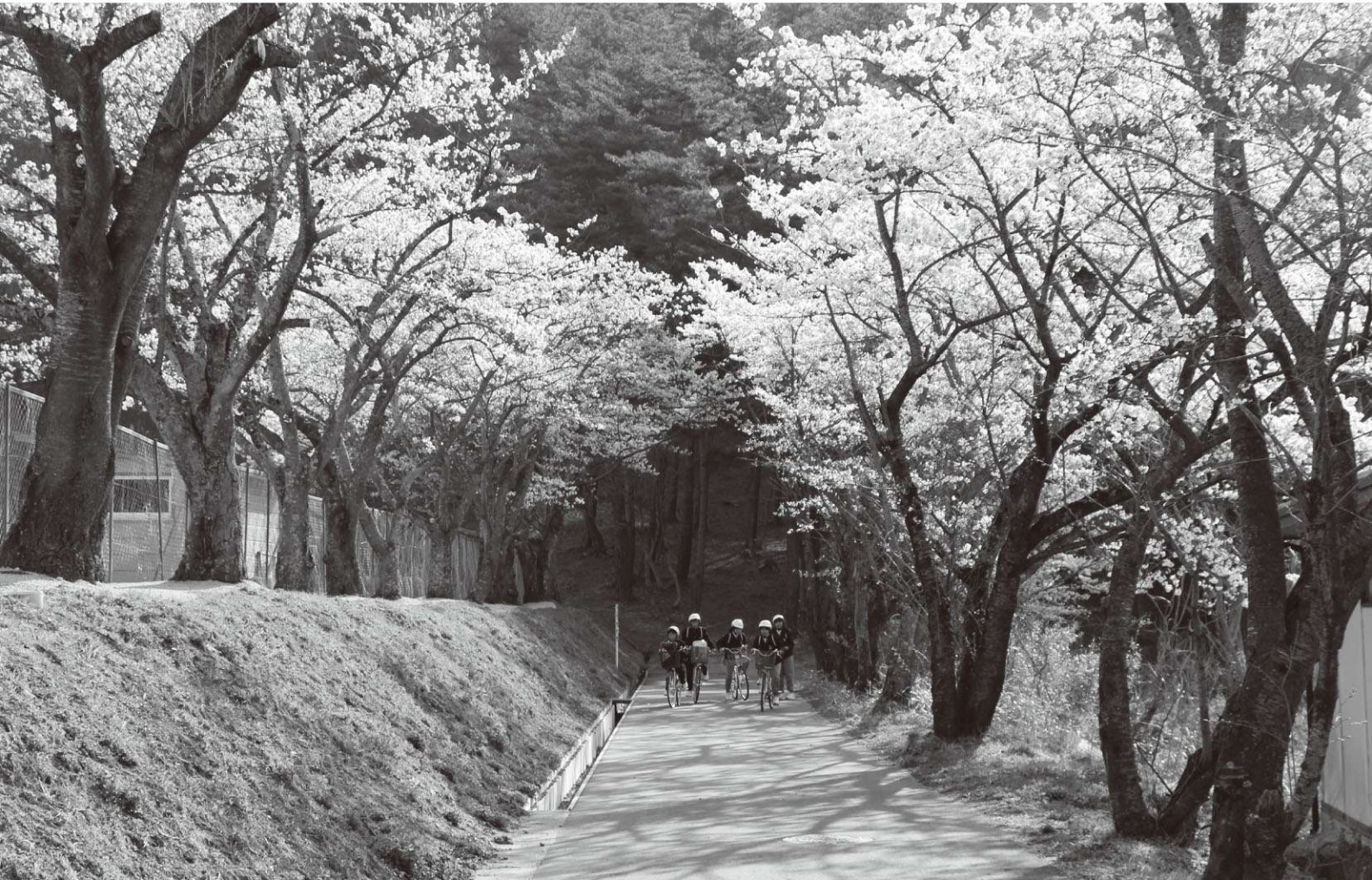
天栄中学校へ登校する生徒