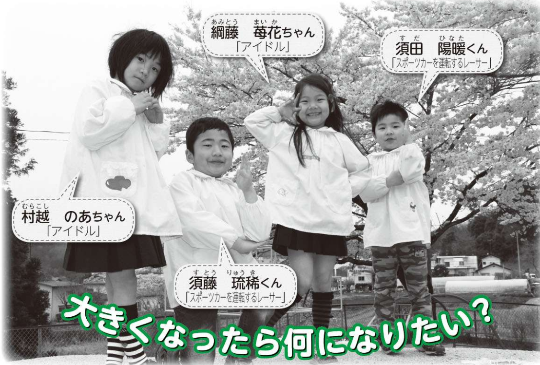
あみとう 綱藤 まいか 梅花ちゃん 「アイドル」