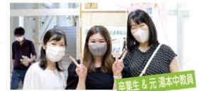
卒業生 & 元 湯本中教員

懐かしい恩師と再会できました。閉校した後の校舎は、地域の人が集まって交流できる所になって欲しいです。