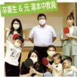
卒業生 & 元 湯本中教員

教師生活最後に卒業生の担任をした事が一番の思い出です。素晴らしい校舎なので、良い活用方法を考えて欲しいです。