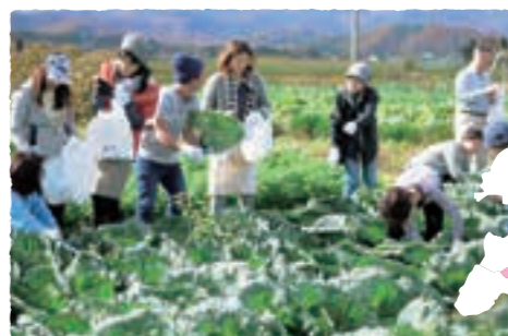
▲生産者の方と一緒に野菜選び