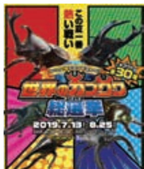
▲大類さんが作成したデザイン