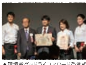
▲環境省グッドライフアワード受賞式