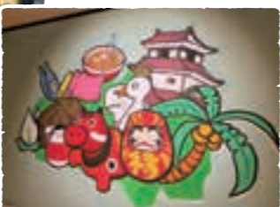
▲会津学鳳高校の学生が描いた壁画