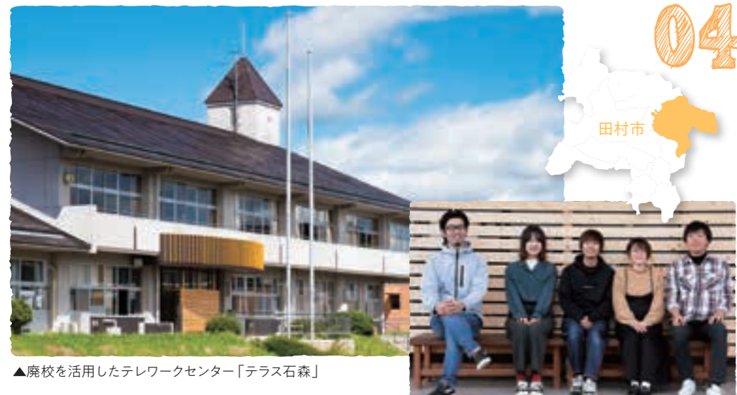
▲高校を活用したテレワークセンター「テラス石森」

まちの魅力について「田村市は街灯も少なく、霧が出ると本当に真暗。でも天気の良い日の夜は都会とは比べ物にならない、とても綺麗な星空が広がります。天候によりいろいろな表情を見せてくれる田村市のそんなところが好きです」と笑顔で話してくれました。最後に移住を考えている方に「言っせ一度、テラス石森に遊びに来てください。と、りあえず一緒に卓球でもしませんか?」