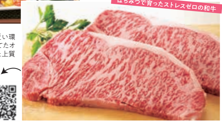
はちみつで育ったストレスゼロの和牛

【有限会社 鈴木畜産】 住所/石川町坂路字馬場宿78 電話/050-3703-8329