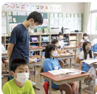
広戸小学校 教室で先生の補助