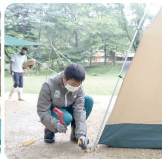
羽鳥湖畔オートキャンプ場 テント設営のサポート