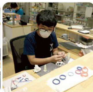
和田精密歯研株式会社 福島営業所 歯科用の器具で製作体験