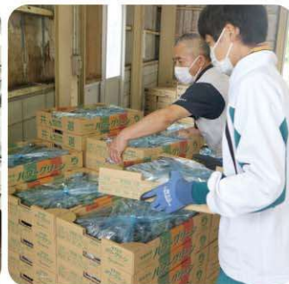
JA夢みなみ天栄支店 集荷場で野菜の荷下し