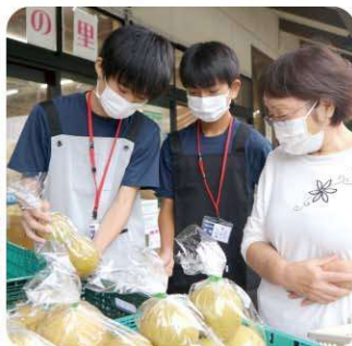
道の駅季の里天栄 お客様に梨の紹介