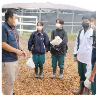
ノーザンファーム天栄 競走馬の厩舎で作業