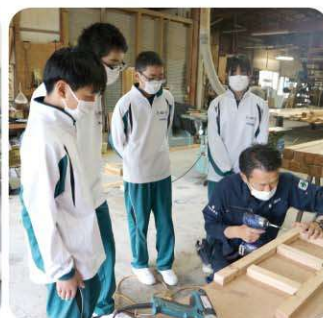
有瀬和建設 プロ大工に学ぶ棚作り