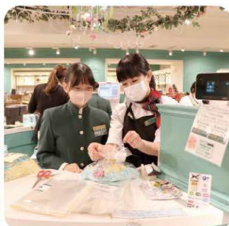
フリティッシュビルズ 英語で接客・ギフトラッピング