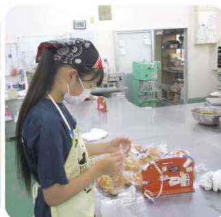
有日の出屋 工場内でパンの包装