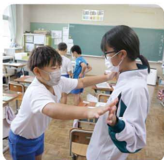
牧本小学校 休み時間、小学生に負けず