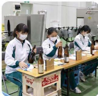
松崎酒造株式会社 お酒のラベル貼り