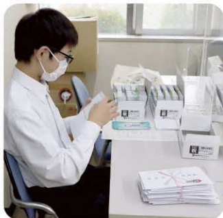
天栄村役場 敬老の日に向けた事務