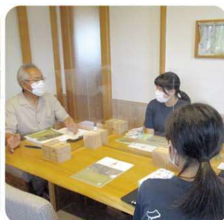
株式会社ツネマツ 幸せな住まいづくりを学ぶ