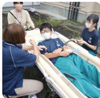
天栄村社会福祉協議会 訪問入浴の介護体験