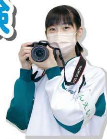
「広報てんえい取材を体験」

参加した中学生からは「こんなに大変だとは思わなかった」「あこがれていた仕事なので楽しかった」などの声が聞かれ、直接働く人と接することで、働く喜びや苦勞、仕事の意義について理解を深める機会となりました。