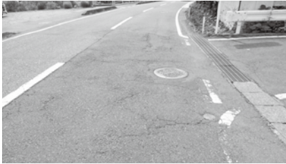
補修予定箇所の一部