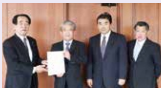
村商工会長らによる要望活動