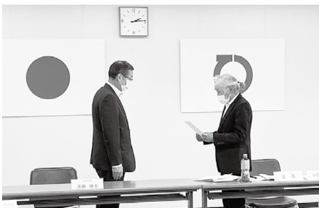
国保運営協議会の様子

令和5年度の国保税は、5月開催の国保運営協議会において審議され、その後6月以降にお示しする予定となっております。