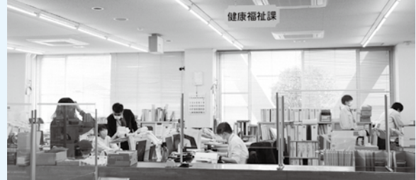
健康福祉課の窓口の様子