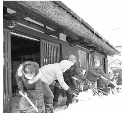
こおりやま広域圏移住体験ツアー