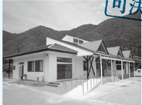
湯本デイサービスセンター