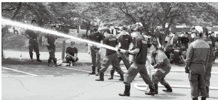
村消防団基礎訓練の様子

じた適切な報酬となるよう、本定例会に団員報酬を改訂する議案を上げし、ご審議いただくこととしております。