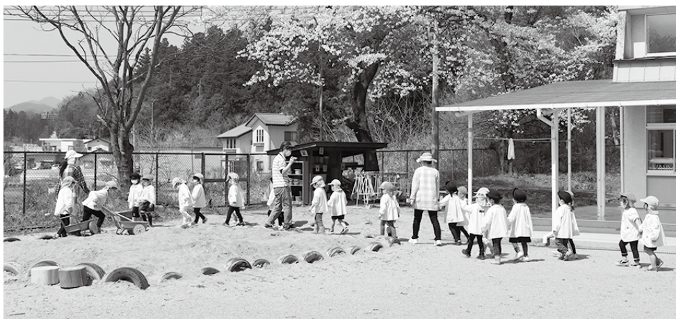
園庭で遊ぶ園児たち

過去10年間の少子化対策等への活用状況につきましては、令和3年度では、幼稚園分の授業料無償化に伴う授業料減収分に400万、学級増加に伴う臨時職員人件費増員分に323万円預かり保育負担金減収分に288万4千円、こども医療費に係る村負担分に625万4千円、合計1,636万8千円に充当しております。改めて村議会議員の皆様へ深く感謝申し上げます。