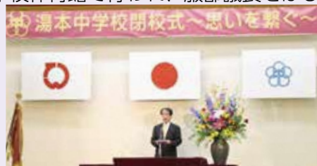
服部議長があいさつを述べました

最後に出席者全員で校歌を歌い、76年の歴史に幕を下ろした湯本中学校の最後の日を見届けました。