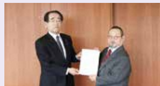
村観光協会長による要望活動