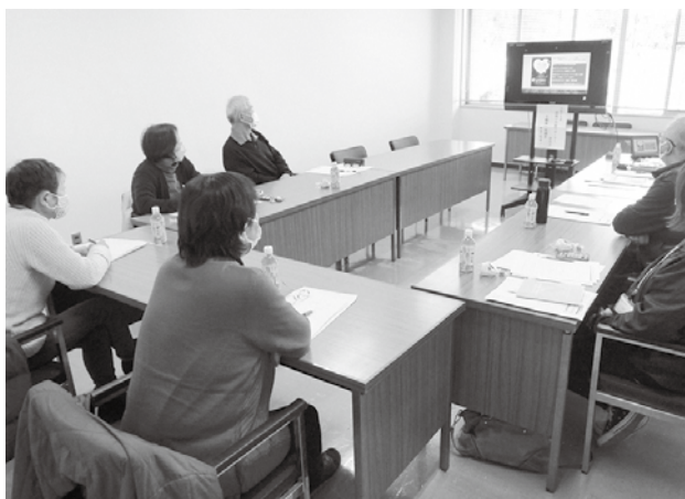
縁結び応援サポーター研修会

「縁結び応援サポーター」を設置し、個別に未婚男女に寄り添いながら、相談支援や出会いの場の創出に取り組んできたことで、現在交際の男女が複数いると