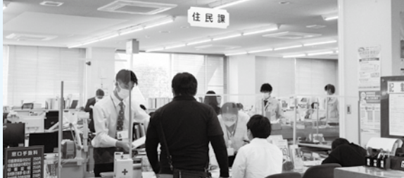
住民課の窓口の様子

今回の改正は、少子化対策や子育て支援の充実、感染症対策等の推進、医療費等の社会保障費の適正化、個人番号制度の普及促進等、現下の重要課題に適切に対応するため、「住民福祉課」を「住民課」と「健康福祉課」へ改編するものです。