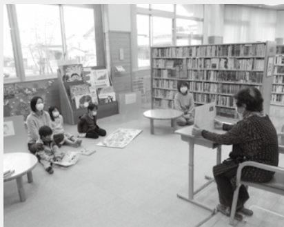
読み聞かせの会の様子