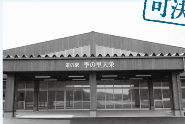
新しいてんえいふるさと公園農林水産物直売施設