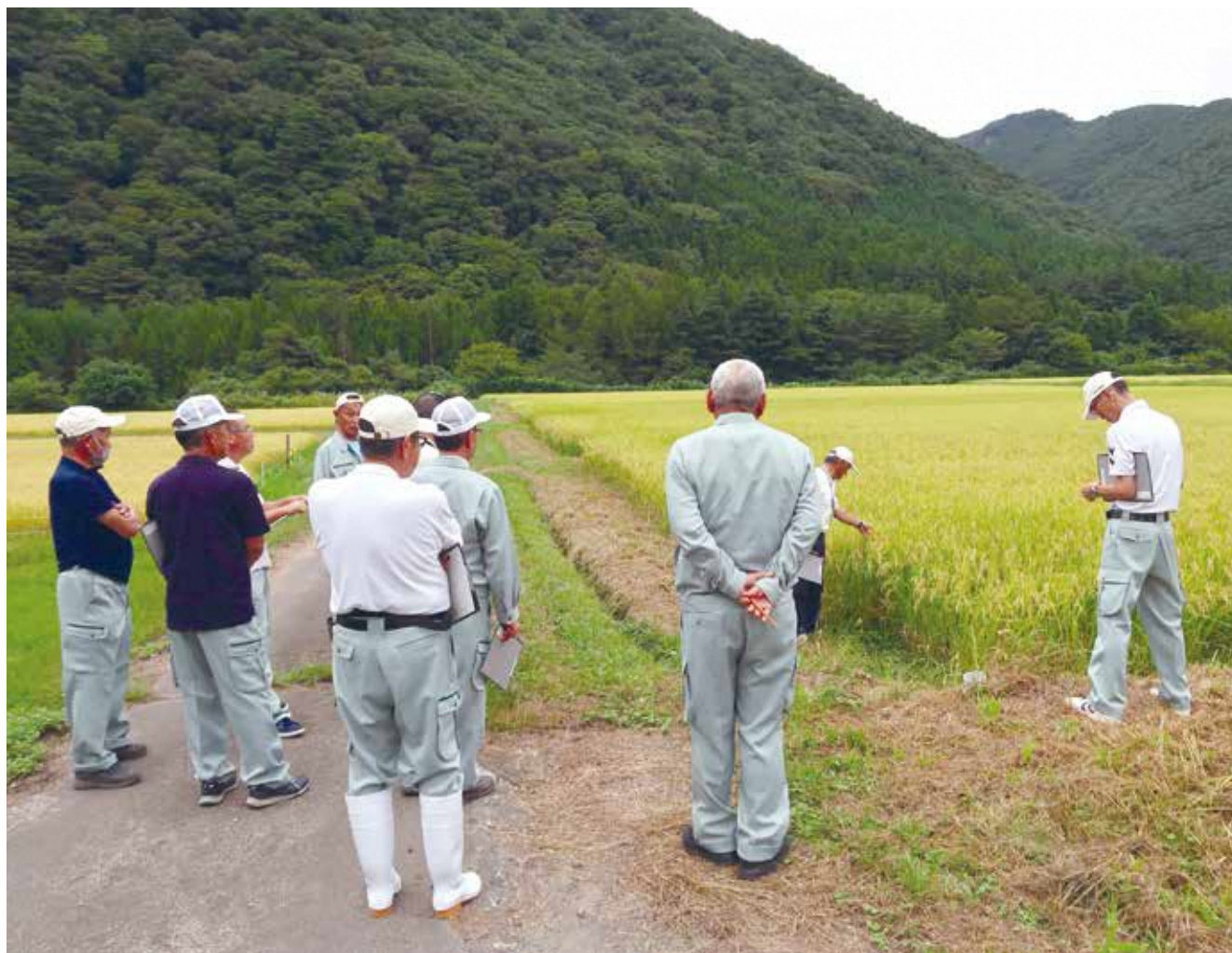
水稻生育状況（湯本地内） ※ 6 ページに記事があります。