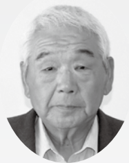
担当地区：飯豊／農政対策委員

天栄村は、豊かな水資源や自然環境に恵まれております。更に、代々受け継がれてきた風土と農業技術があります。勤勉で心豊かな人・郷土愛に満ちた歴史・心安らぐ豊かな自然。このような土壌の中で育まれた、農業生産物を関係機関と連携し、全国の消費者に向け、情報を発信するとともに、常に生産者の身近にあり、皆様の役に立つ農業委員でありたいと考えております。 末筆となりますが、皆様方のご健勝ご多幸を念じつつ就任の挨拶とさせていただきます。