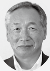
担当地区：上松本・下松本／農政対策委員長

今後も米価の低迷が危惧されます。また、生産農家においては、後継者不足が深刻な問題でもあります。農業委員の一員として、関係機関と連携して農家の皆様のお役に少しでも立てればと思います。任期満了まで頑張りますので、皆様のご指導、ご協力をよろしくお願いいたします。