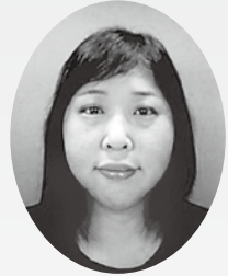
担当地区：今坂・中屋敷・太多郎／農政対策委員