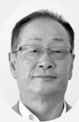
担当地区：牧之内／農地対策委員長

農地対策委員としてこれらの問題の防止に努めてまいりますので、皆様のご指導のほどよろしく申し上げます。