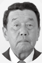
担当地区：大里東部・大里南部／農地対策委員