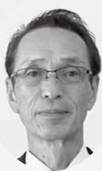
担当地区：高林・小川／農地対策委員

至らない点が多々あるかと思いますが、皆様のご協力をいただきながら、農家と行政のパイプ役として少しでも貢献できればと考えておりますので、よろしくお願いいたします。