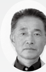
担当地区：大里北部・大里中部／農地対策副委員長

この度、今坂・中屋敷・太多郎地区の農業委員に任命されました。私自身、数年前から新規で就農を始めました。農業を始めたことにより、遊休農地や耕作放棄地の発生や、農家の後継者を日々感じております。農作業は大変なことでも多く、根気強く柔軟に対応しなければならぬことの連続ですが、大きな達成感が感じられる魅力ある仕事のひとつだと思っております。地域の方々にご指導、ご協力いただきながら、若い方や女性にも農業の魅力を知ってもらえるように努めてまいりますので、どうぞよろしくお願いいたします。