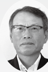
担当地区：沖内／農政対策委員

この度、農業委員会委員改選により引き続き飯豊地区担当として任命され、新たな気持ちに返り農業委員として「担い手への農地利用の集積・集約化」「遊休農地発生解消」「農業への新規参入の促進」などに向けて、3年間の任期の中で勉強し、業務内容への理解を深めながら努めてまいります。よろしくお願いいたします。