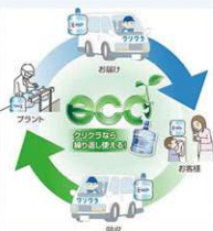
繰り返し利用できるサステナブルボトル

コンビボックスは『地域と環境に貢献できる企業』をスローガンにSDGsの活動を3つ実施しております。1つ目は宅配水事業クリクラで使用しているサステナブルボトルの使用。洗浄し繰り返し使用する事でプラスチックゴミの削減に貢献していきます。2つ目は児童に向けてのプラスチック問題に関するイベントの実施。このイベントに参加していただいた児童には毎年変わるテーマに沿って絵を描いていただき、優秀な作品には描いた絵をプリントしたオリジナルマイボトルやオリジナルマイカップをプレゼント。3つ目はマイボトル専用の無料給水所(クリクラ)を設置し地域の皆さんが無料でお水を汲める場所のご提供とマイボトル使用の普及啓発の実施。少しずつではありますがSDGs達成に向け取り組んでいきます。