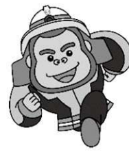
組合イメージキャラクター 「マモタン」

気象条件を考えて火入れを検討し、実施する際は事前に役場に申請し「許可」を受けてから、消防署への届出が必要となります。