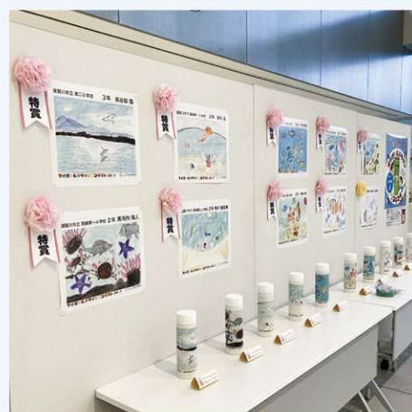
マイボトルデザインコンテスト

村では村内でSDGsに取り組む企業・団体・教育機関などを「SDGsパートナー」として認定しています。申請は、企画政策課企画調整係(☎82-2333)まで。