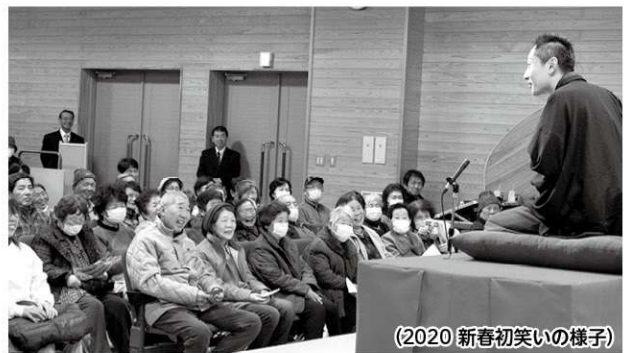
(2020 新春初笑いの様子)

令和6年の新春に家族みんなで大いに笑って幸せな一年を迎えてみませんか。ぜひ、ご来場ください。