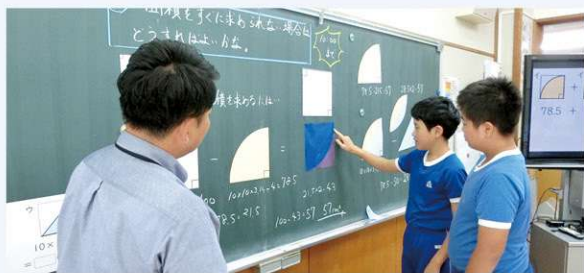
児童が主体的に取り組む授業風景

また、子どもも教職員も少ない人数の中で、男女差関係なく仲良く過ごし元気に日々の学校生活を送っています。この「湯本の環境で学べるメリット」を最大限に活かし「質の高い教育を湯本の子どもたちみんなへ」を目指しています。