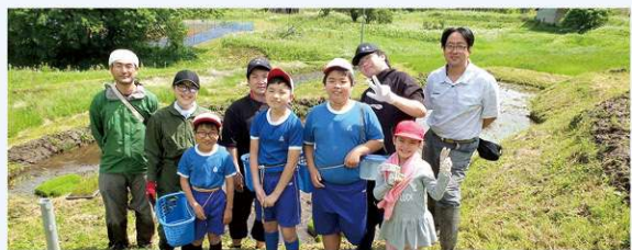
湯本の棚田で、1年生から6年生まで全員参加の稲作体験

湯本小学校では“SDGs style of Yumoto”をテーマに、少人数ならではの丁寧な学習指導、自然豊かな土地柄を活かし、森林の大切さや生物多様性の大切さを学ぶ環境学習、地元の企業・施設を活用した「湯本でしかできない」「地元の皆様とのふれあいのある」学習に取り組んでいます。