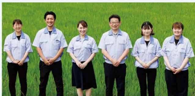
食品事業部メンバー