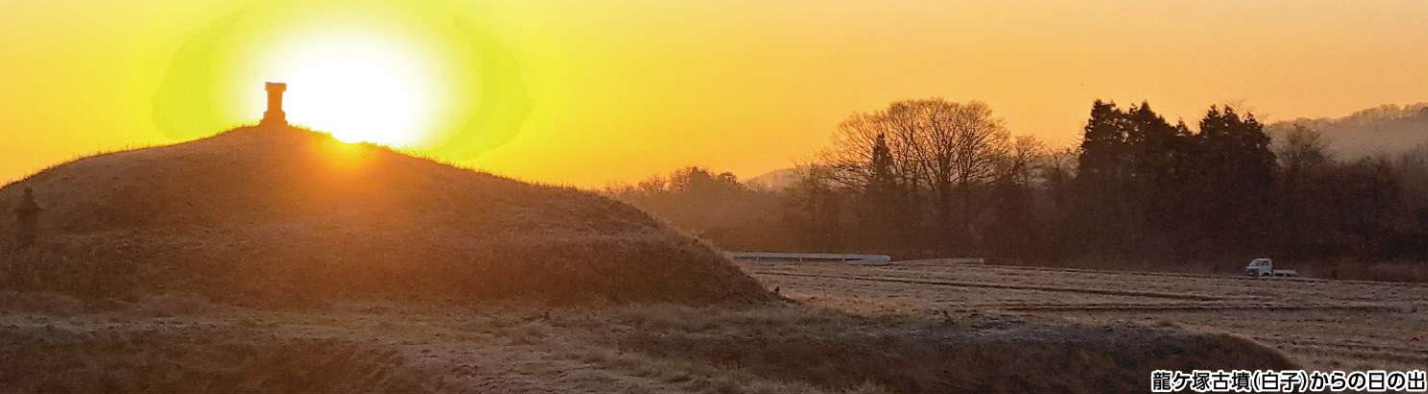
龍ヶ塚古墳(白子)からの日の出

結びに、本年が村民の皆様にとりまして平穏で幸せに満ちた一年となりますよう心からお祈り申し上げます。年頭のごあいさついたします。