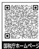
国税庁ホームページ

国税庁ホームページの「確定申告書等作成コーナー」を利用すると、スマートフォンやパソコンを使って確定申告書の作成が出来ます! 作成した確定申告書の提出は、e-TAXで自宅から都合のよい時間に送信するか、申告書を印刷し郵送することで、税務署への持参も必要ありません。 詳しい操作方法は、国税庁の特設ホームページをご覧ください。