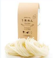
地元食材を活用した「うめめん」

アルファ電子では、SDGsの達成に向け、当社事業において「安全と品質管理：ISO9001・ISO14001・ISO13485・ISO22000 認証に基づく安全で高品質な製品製造の継続」「環境配慮型経営の実現：食品廃棄物のリサイクル化と食品循環資源の積極活用」「物心両面の幸福の追求：研修実施等による人材育成への積極投資」「地域社会とのつながり：地元食材使用、地産地消の推進に