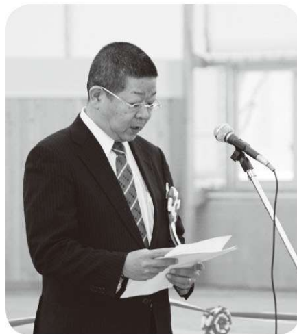
祝辞を述べる森本復興庁参事官