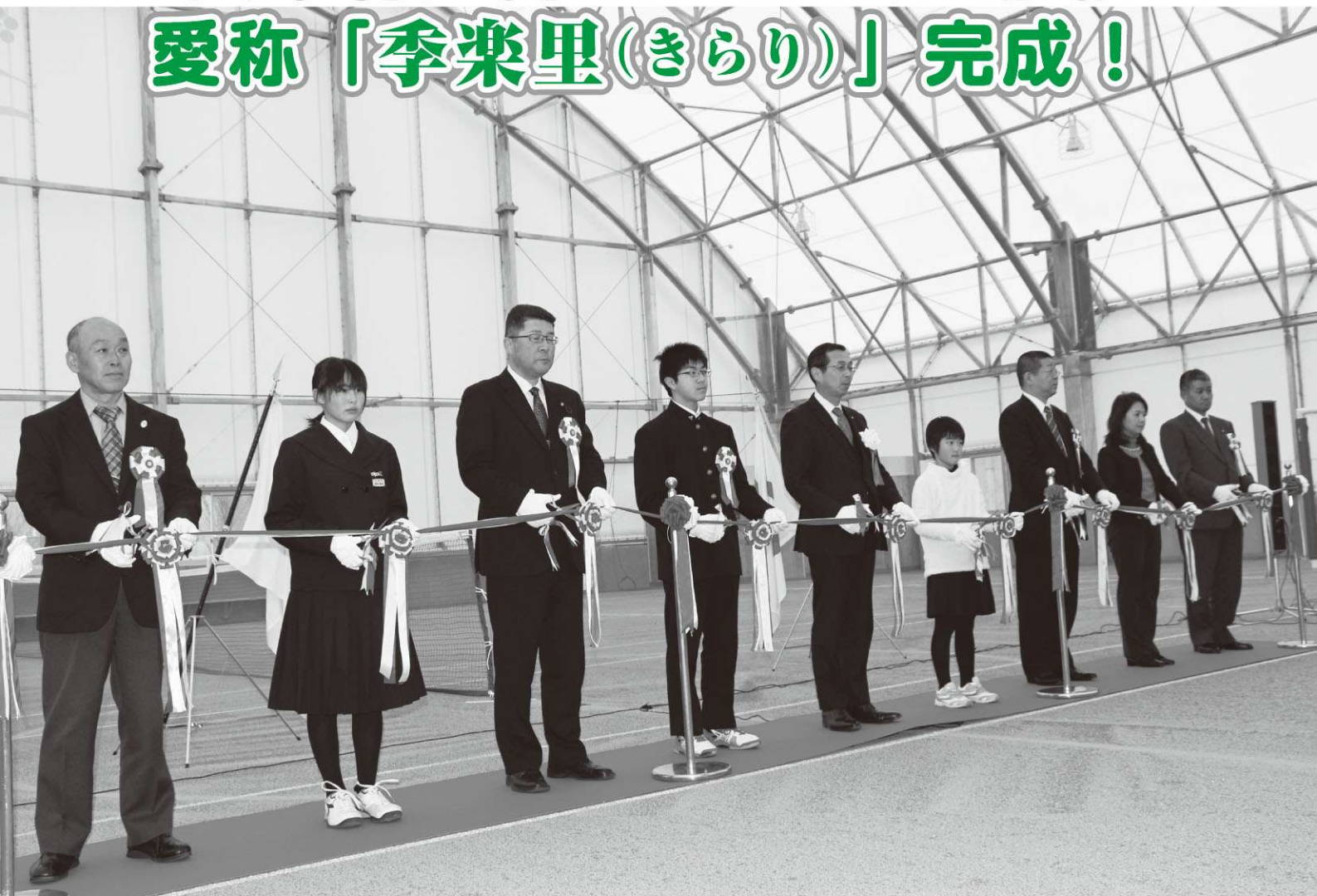
落成式のテープカットの様子