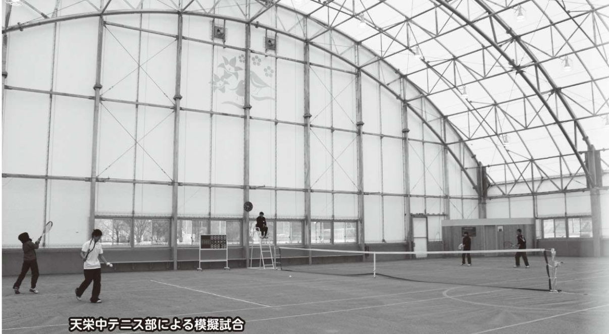
天栄中テニス部による模擬試合

福島定住緊急支援助交付金（子ども元氣復活交付金）を活用し、昨年3月から整備が進められてきた天栄村屋内スポーツ運動場の落成式は平成26年12月25日（木）、現地で関係者約60人が出席し挙行されました。