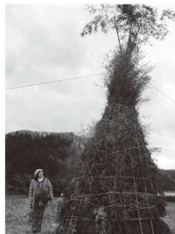
どんど焼きのやぐら

いまだに数える程しかスキーをしたことがありません。幸い雪が少ない事にやきもきすることはありませんが、今年の冬はもっと新しい、“雪ってこんなに面白んだ！”と再発見できる雪との戯れができるのではないかと期待しています。まずは、雪も、降りますように！