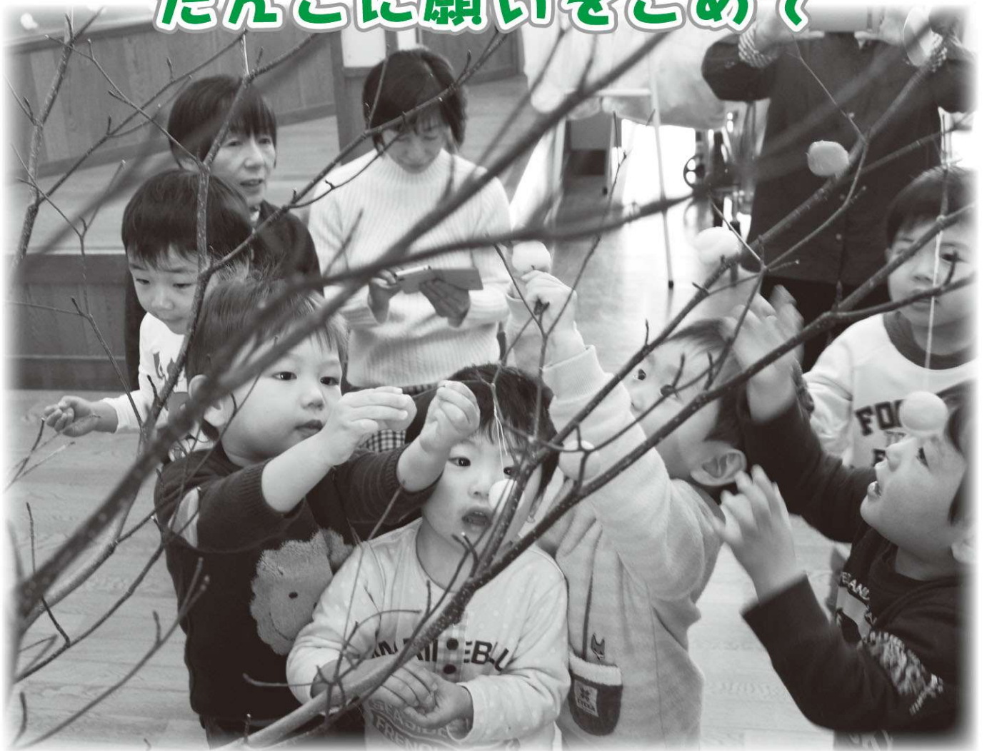
天栄保育所 だんごさしの様子