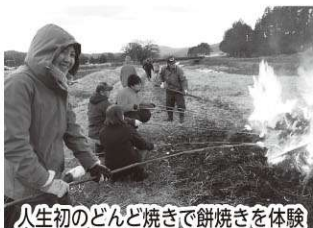
人生初のどんど焼きで餅焼きを体験