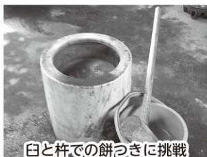
臼と杵での餅つきに挑戦

今後も年中行事を通して、地域の伝承文化に触れる機会があると思いますので、地区ごとの違い、謂れ、歴史等に注目していきたいです。