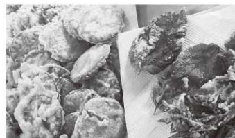
ヨモギ菜とビスケットの天ぷら