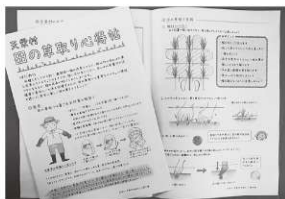
田の草取りマニュアルを作りました!

頂上からの眺めは勿論、山菜・植物・ブナ林・あすなろなど道中色々教えてもらいながら楽しむことができました！