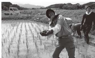
田んぼで草取り中です