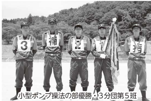
小型ポンプ操法の部優勝・3分団第5班