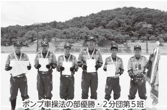
ポンプ車操法の部優勝・2分団第5班

引き続き行われた第32回消防操法大会では、ポンプ車操法の部に4チーム、小型ポンプ操法の部には9チームが出場し、どのチームも日頃から厳しい練習を積み重ねてきた成果が発揮され、士気あふれる迅速な操作で、消火までの技術を競い合いました。