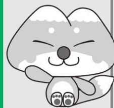
天栄村マスコットキャラクター ふたまたぎつね