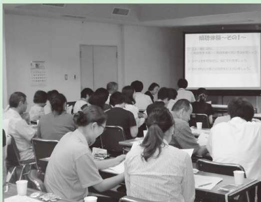
※写真は昨年度の様子