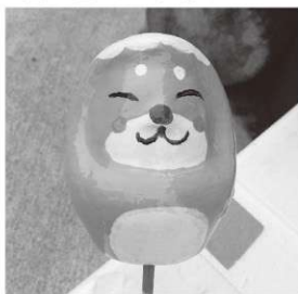
雪は無いものの、とても寒かったです ツアーでのだるまの絵付け体験