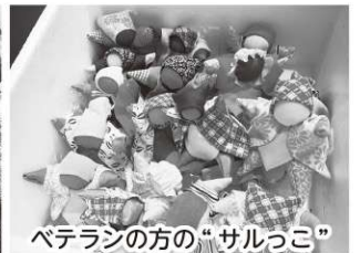
ベテランの方の“サルっこ”