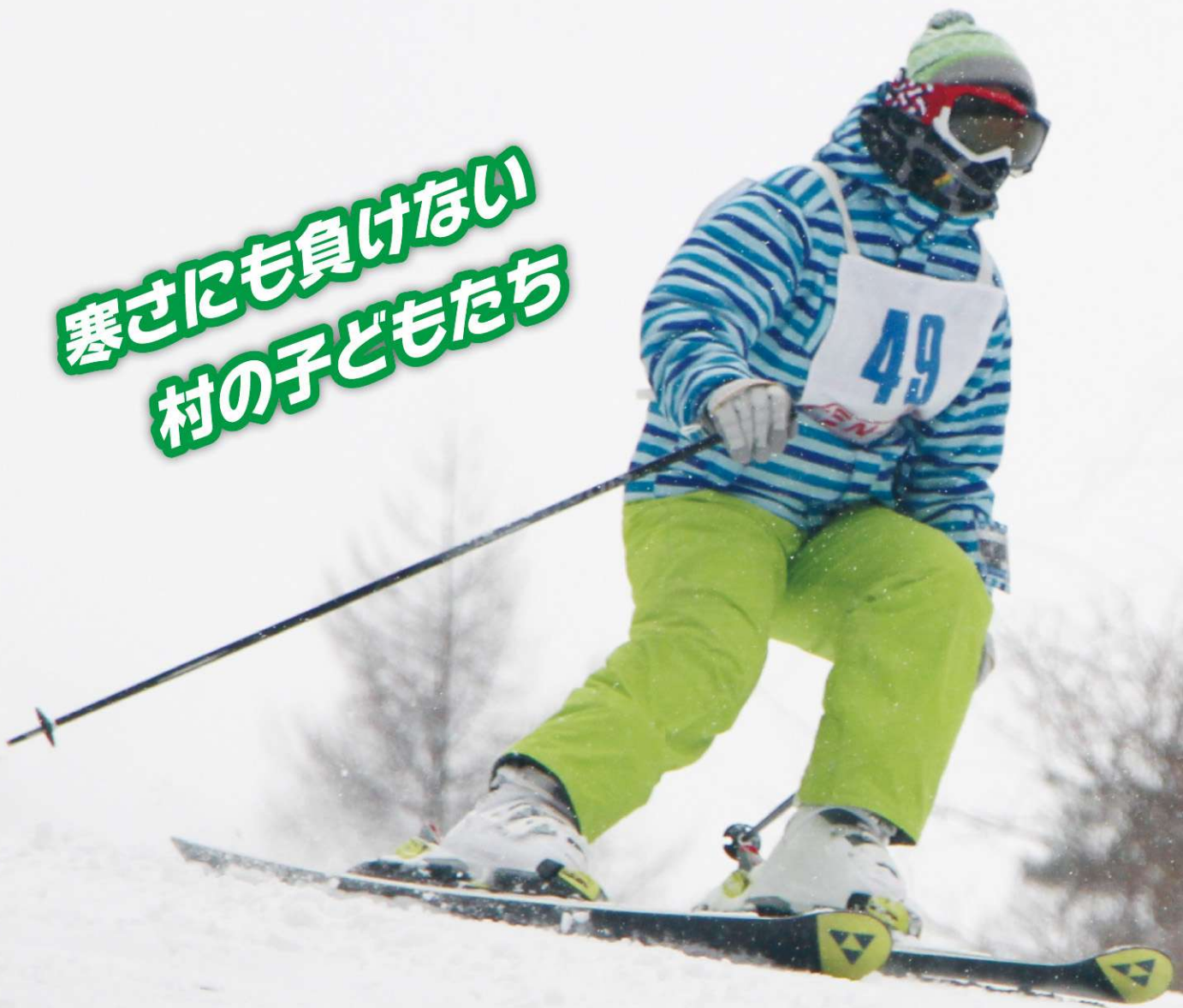
第 58 回湯本地区区学校スキー大会の様子