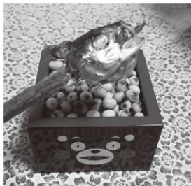
節分の準備万端です