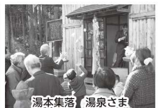
湯本集落 湯泉さま