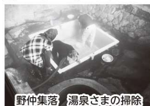
野仲集落 湯泉さまの掃除