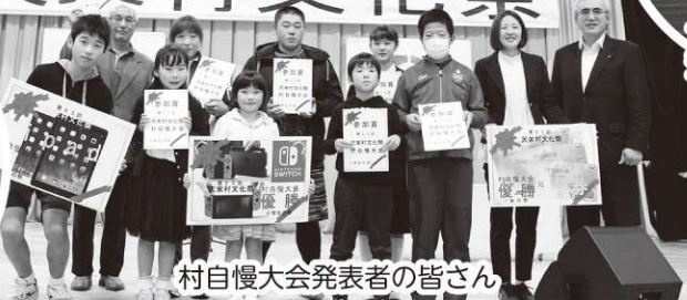
村自慢大会発表者の皆さん