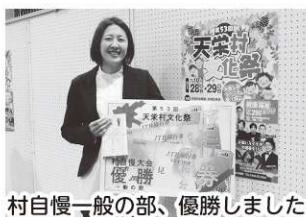
村自慢一般の部、優勝しました

油みそもそうでしたが、聞いて自分で作るものは簡単にはできないものですね。（当たり前？）“郷土の味”というのは難しいな！と思います。