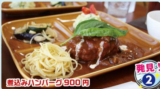
煮込みハンバーグ 900円