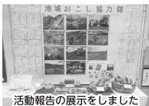
活動報告の展示をしました