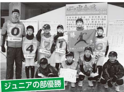
ジュニアの部優勝

スポーツ雪合戦東日本大会のジュニアの部が1月21日(日)、一般・ミックス・レディースの部が1月28日(日)、羽鳥湖高原交流促進センターの特設コートで開催されました。ジュニアの部には県内の小学生18チームが、3部門には県内外から47チームが出場し、予選リーグと決勝トーナメントで競い合いました。村内からも全部で3チームが出場しましたが、惜しくも予選リーグでの敗退となりました。