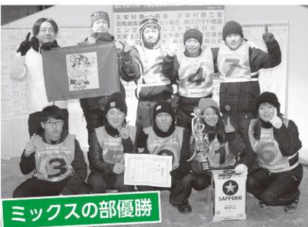
ミックスの部優勝