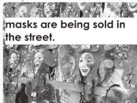
masks are being sold in the street.