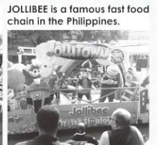
JOLLIBEE is a famous fast food chain in the Philippines.