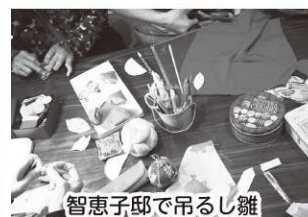
智恵子邸で吊るし雛