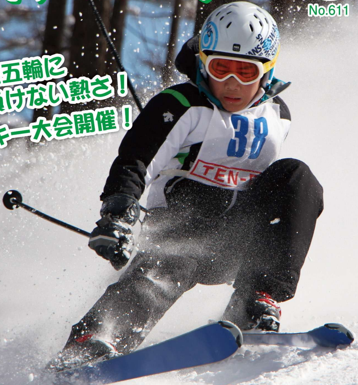
村内学校スキー大会の様子