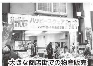
大きな商店街での物産販売