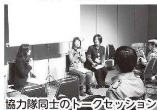
協力隊同士のトークセッション