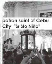
patron saint of Cebu City "Sr Sto Niño"