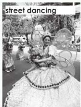
street dancing some companies join the float competition with their unique designs/ decors.

ついにクリスマスとお正月が終わり、ずっと寒い日が続くため、1月と2月はみんな(子供を除いて)あまりわくわくしません。実際、私たちは、1月22日から28日まで雪が降り続く寒い1月を経験しました。私は、スノーエンジェル(新雪の上に寝て付けた人型)を作ったり、雪かきを経験したりすることができましたが、やはりまだセブの暖かい天候が恋しいです。それ以上にセブ最大のお祭りである「シヌログ」に参加できないのは寂しいです。クリスマスとお正月の後、私たちはセブの守護聖人サントニーニョ(幼きイエス・キリスト)を通して神から受け取ったすべての祝福に感謝することができるシヌログを祝うことをいつも楽しみにしています。1月の第3日曜日に毎年シヌログを祝います。私たちはいつもミサに出席し、宗教活動に参加したり、マルディグラを見たり、友人と食事をしたり、ストリートダンスやコンサートなどを見ることができます。シヌログはセブに住んでいる人や外国人にも大きな影響を与えました。他の国からの観光客もこのフェスティバルを訪れます。ここに私がこの記事のために自分の写真を私の友人から集めた写真があります。楽しそうでしょ!