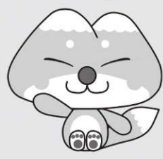
天栄村マスコットキャラクター ふたまたぎつね