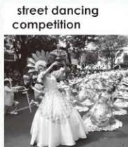
street dancing competition