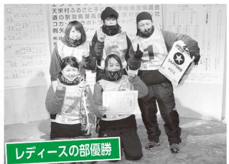
レディースの部優勝