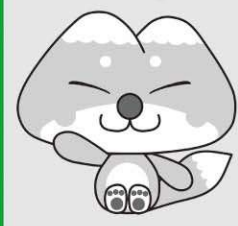
天栄村マスコットキャラクター ふたまたぎつね