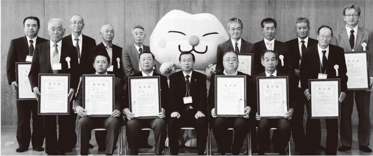
第11回「天栄米」食味コンクール受賞者(敬称略)