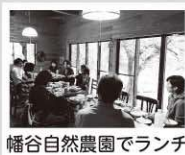
幡谷自然農園でランチ