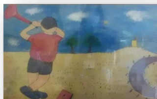
「こんしんのショット」