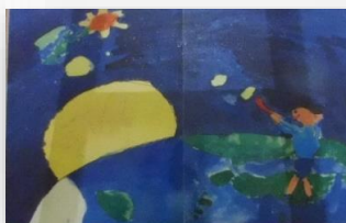
「別の星まで飛んで行くボール」