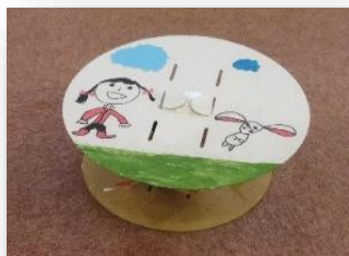
「かめかいじゅうのころころ」