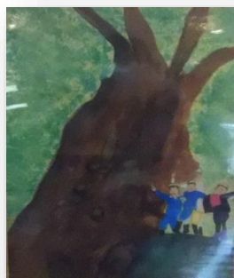
「日本一のこぶなら」