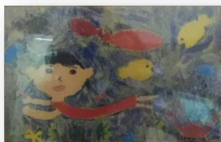
「うみのなかでおにごっこをしているよ」